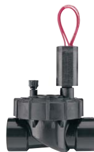
PGV-100JT - G Średnica wlotu: 1" (25 mm) Wysokość: 14 cm Długość: 11 cm Szerokość: 8 cm