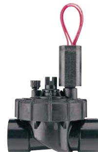
PGV-101JT-G Średnica wlotu: 1" (25 mm) Wysokość: 14 cm Długość: 11 cm Szerokość: 8 cm