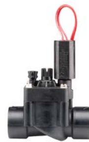
PGV-101/101 Średnica wlotu: 1" (25 mm) Wysokość: 13 cm Długość: 11 cm Szerokość: 6 cm