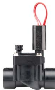
PGV-100/101 Średnica wlotu: 1" (25 mm) Wysokość: 13 cm Długość: 11 cm Szerokość: 6 cm

* Informacje dotyczące Accu-Sync znajdują się na stronie 98